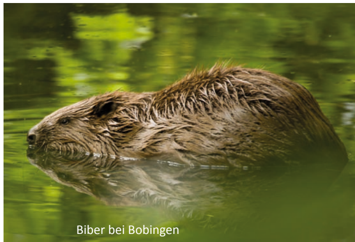
Biber bei Bobingen