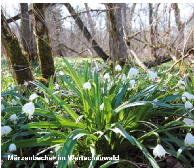
Märzenbecher im Wertachauwald