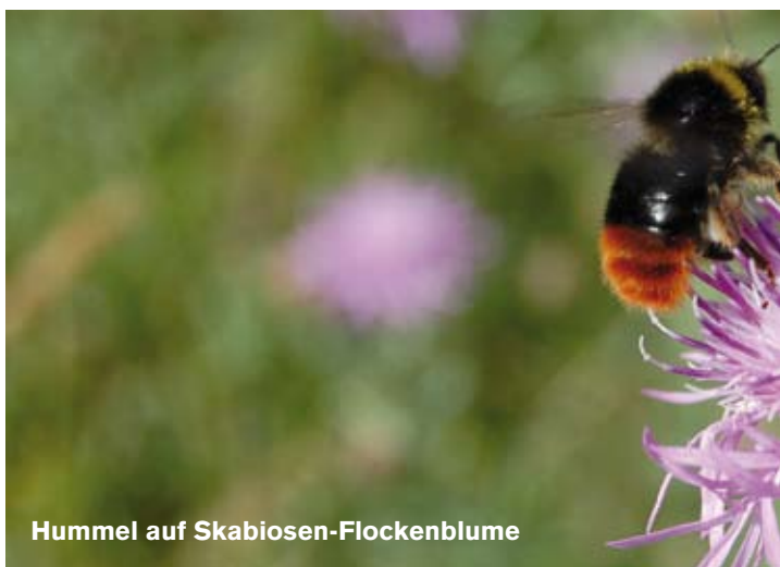
Hummel auf Skabiosen-Flockenblume

Heimische Tiere und Pflanzen sowie ihre Lebensräume mit Hilfe gezielter Pflege- und Gestaltungsmaßnahmen erhalten und fördern - das ist die Schwerpunktaufgabe, der sich der Landschaftspflegeverband Landkreis Augsburg e.V. mit viel Engagement schon seit über 20 Jahren widmet. Seltene gefährdete Arten mit meist sehr speziellen Lebensraumansprüchen benötigen unser besonderes Augenmerk. Mit genau auf die Bedürfnisse