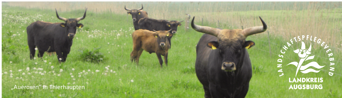
„Aueroxen“ in Thierhaupten

Anmeldung: Bis spätestens 03.10.; lpv@lra-a.bayern.de oder unter 0821/3102-2852