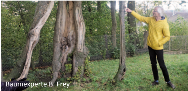
Baumexperte B. Frey

Was können uns Bäume erzählen? Ein knorriger Baum hat viel erlebt und zeigt dies in seiner Körpersprache. Fachwissen und Baumgeschichten für Kinder und deren Eltern und Großeltern.